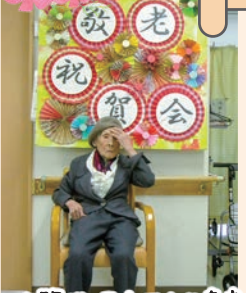
・内閣総理大臣より表彰