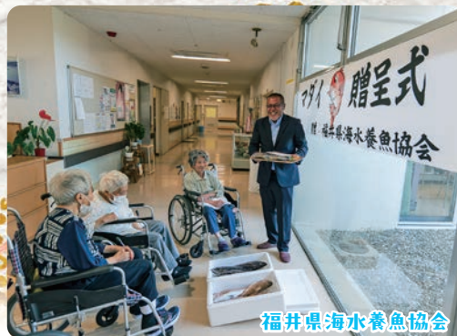
福井県海水養魚協会