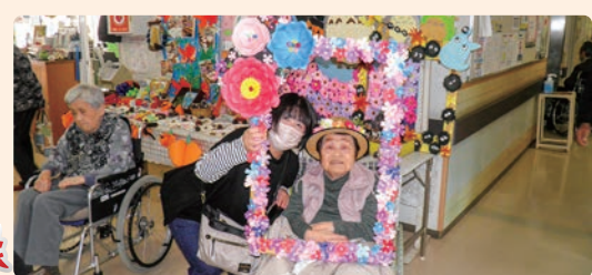
手作り作品の前で「ハイポーズ」