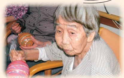
童心に帰って楽しみました