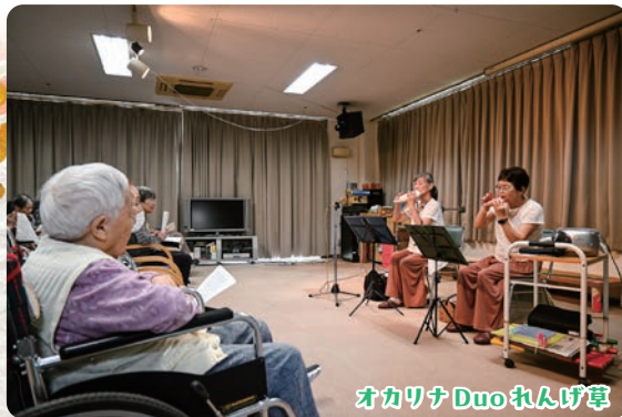
オカリナ Duo れんげ草