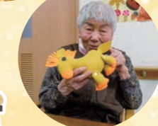
今年の干支を 縫いました。