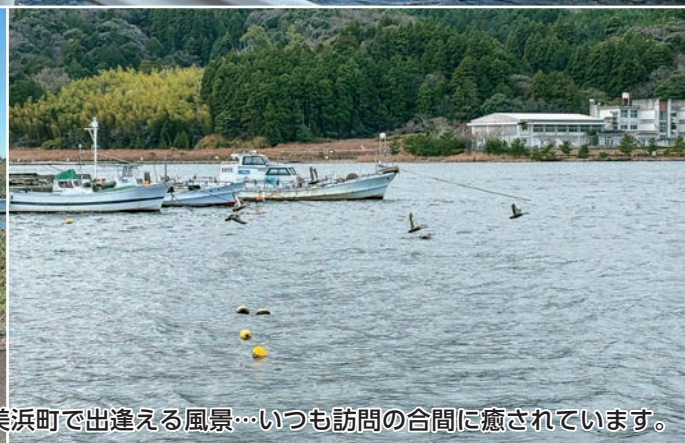
美浜町で出逢える風景…いつも訪問の合間に癒されています。