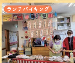
ランチバイキング