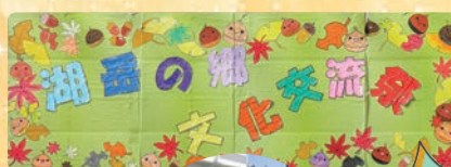
湖国の郷文化交流会