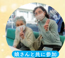
娘さんと共に参加