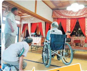
大藪地区 かなやけ地蔵