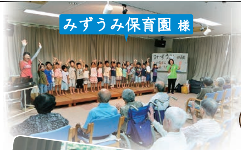
みずうみ保育園様