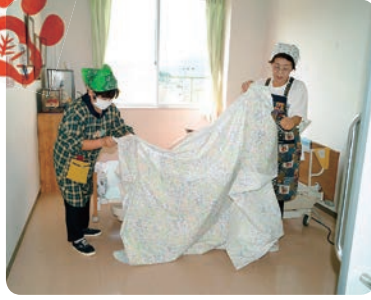
美浜町婦人福祉協議会様