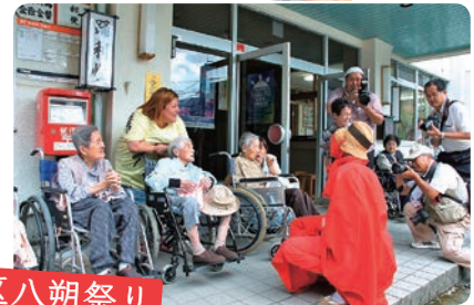
新庄地区八朔祭り