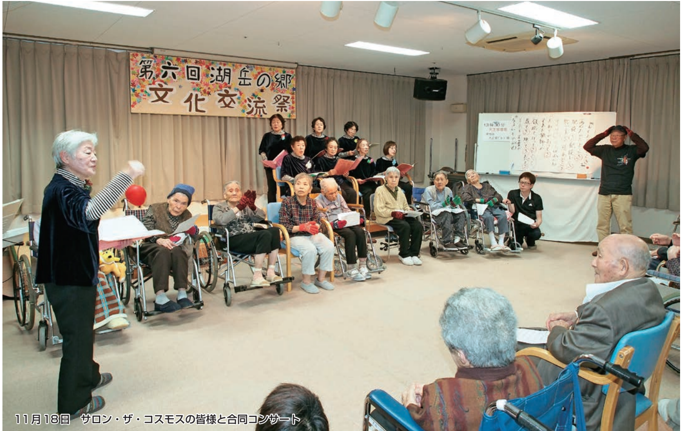
11月18日 サロン・ザ・コスモスの皆様と合同コンサート