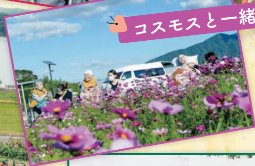
コスモスと一緒に